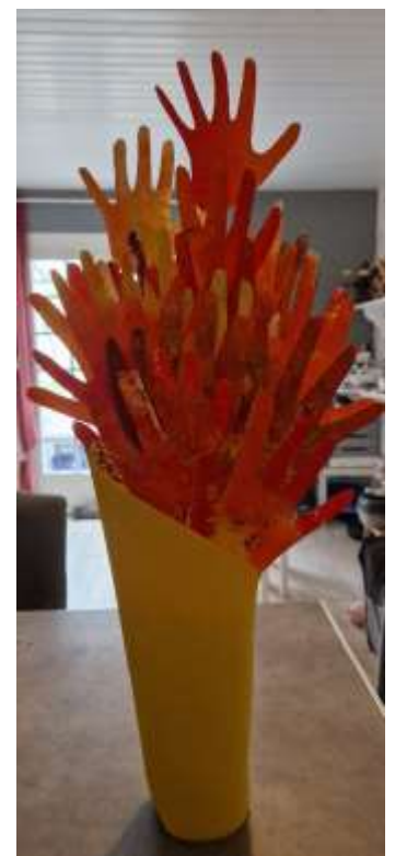
La flamme olympique